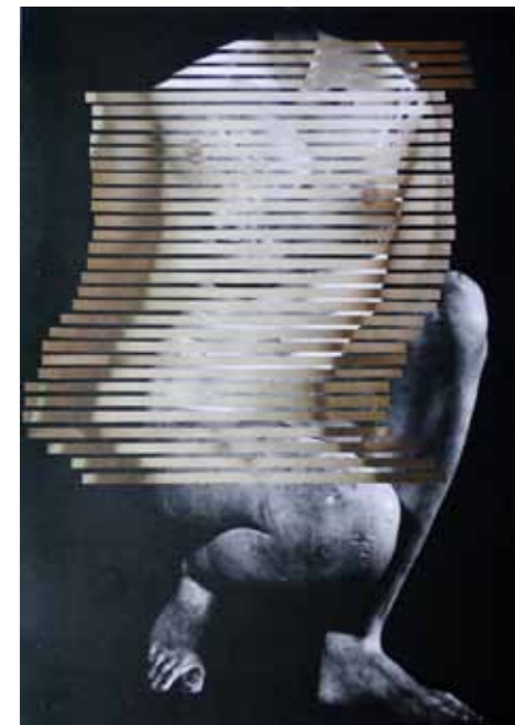
קוס אהמט, point of juncture, הדפסת זירוקס צבע על נייר, 41X28.5 סמ, 2012 Cos Ahmet, point of juncture, printed paper on color xerox, 41X28.5 cm, 2012