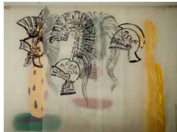
אבי קריצמן, ללא כותרת, מדיה מעורבת על נייר פרגמנט, 2012 Abraham Kritzman, untitled, Mixed media on paper, 2012